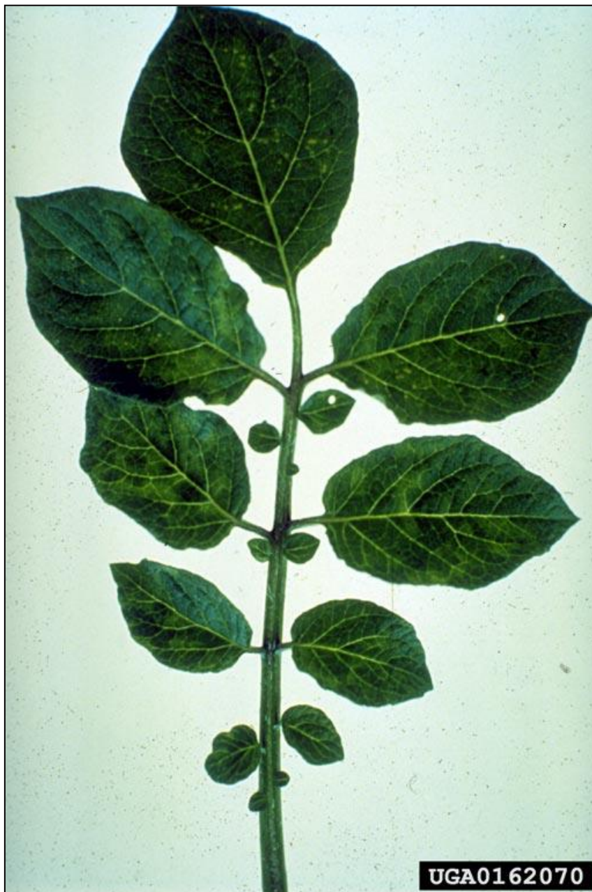
Symptoms of Andean potato latent tymovirus infection in Peruvian potato cv. Mi Peru.